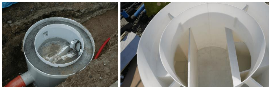
Obr.: Ukázky šachtových den

Polypropylénová dvouplášťová šachtová patka jako ztracené bednění pro nástavbu ze standardních betonových skruží s Parshallovým žlabem. Šachtová dna se vyrábí v dimenzi DN 1000 a DN 1500.