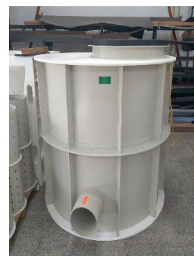
Obr. Kanalizační měrná šachta