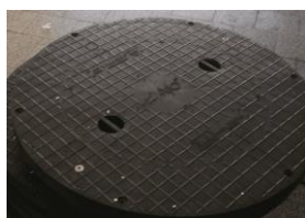
PVC 950 mm

Návrhy měrných šachet jsou individuální dle Vámi dodaného podélného profilu, dle požadovaného měrného rozsahu a kvality vody. Výpočty hydrauliky provádíme pro naše zařízení zdarma.