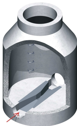
v šachtě DN 1000

Při odběru několika měrných žlabů je sjednáván individuální rabat 5 až 20 %.